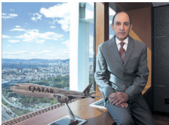
Akbar Al Baker es el CEO de Qatar Airways

La delegación de Qatar Airways, que el próximo lunes tiene previsto participar en la presentación institucional del acuerdo firmado con el FC Barcelona como próximo patrocinador de la camiseta del club blaugrana, tiene ante sí una agenda muy apretada. Ese mismo día, la delegación catari, comandada por su CEO, Akbar Al Baker, tiene previsto entrevistarse con las máximas autoridades catalanas. Primero pasará por el Palau de la Generalitat para reunirse con el President, Artur Mas, y posteriormente cruzará la Plaça Sant Jaume para entrevistarse con el alcalde de Barcelona, Xavier Trias. Por la noche celebrarán una cena con una destacada representación de empresarios catalanes. El objetivo es dar a conocer sus proyectos empresariales.