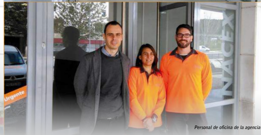
Personal de oficina de la agencia

7115 LISBOA Rua de Campolide nº 380 B 70041 Lisboa Tel. 00 351 210 190 032